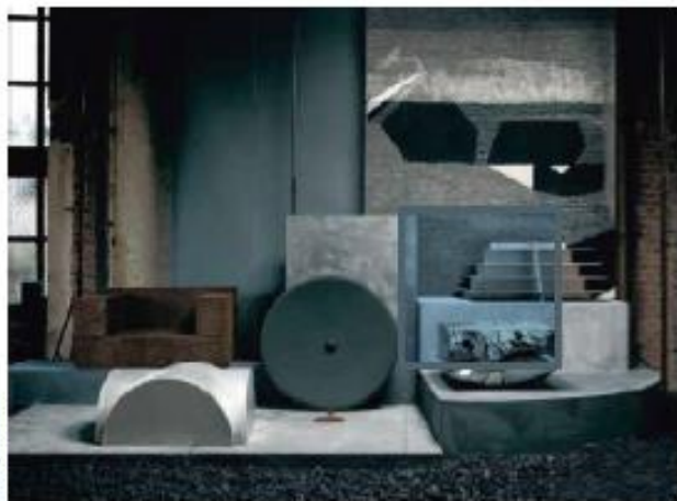
Tussen de primeurs verduidelijken we ook de ontwerp-gedachte

Deze week vindt in Milaan het grootste meubelevenement ter wereld plaats. Honderdduizenden bezoekers trekken dan naar de Italiaanse stad om interieurtrends op te pakken. Deze drie Belgen pakken er uit met primeurs.