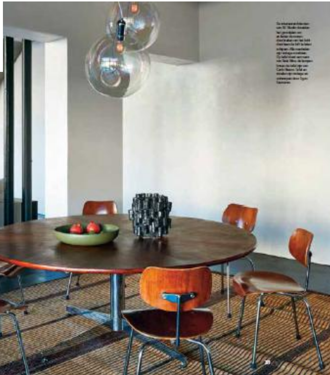
De architecten van de AE Studio hebben de eetkamer ontworpen met een betonnen tafel en een houten stoel. De eetkamer is ontworpen door de architecten van de AE Studio.