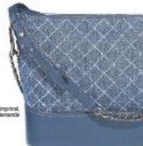
Sac Cabellin en cuir et dérivé imprimé, Chanel, prix sur demande